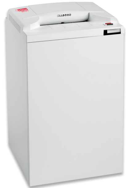
L/D/A 49 x 44 x 90 cm