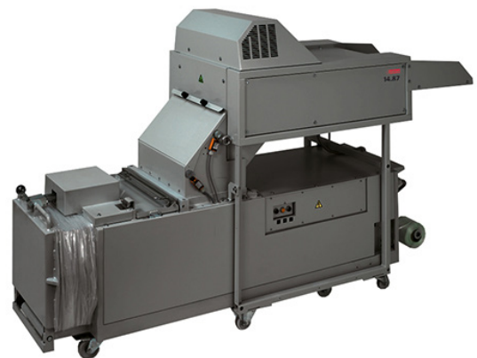
L/B/H 268/327 x 80 x 164 cm

Die intimus® Großshredder haben sich seit Jahrzehnten als zentral positionierte Anlagen für die datenschutz-gerechte Entsorgung ausgedienter Datenträger bewährt. Die Modellapalette bietet Varianten, die bis zu 550 Blatt/h oder auch komplette Aktenordner in einem Durchgang verarbeiten können. Der geräumige Aufgabebereich mit integriertem Einzugsförderband sorgt für kontrolliertes, ermüdungsfreies, sicheres und zügiges Beschicken. Das geshredderte Material wird im großvolumigen, fahrbaren bzw. ausschwenkbaren Auffangbehälter unter dem Schneidwerk gesammelt. Die Shred-Press Kombinationen sind gekoppelt mit einer Ballenpresse zur sofortigen vollautomatischen Verdichtung des Schnittgutes zu kompakten Ballen. Der Reduzierungseffekt gegenüber der losen Sammlung des Schnittgutes beträgt ca. 70%.